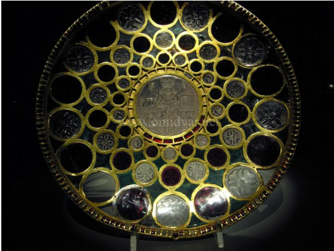
جام خسرو پرویز