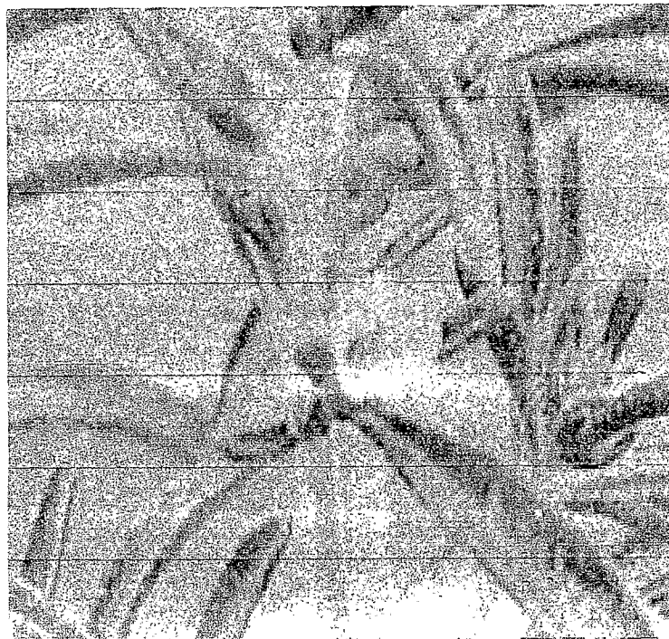
تصویر ۱- سرشاخه گیاه مرزه

آن جا که این گیاه در مرحله ی گلدهی حاوی بیشترین میزان اسانس است، برداشت این گیاه در این زمان انجام می گیرد. بخش های مورد استفاده این گیاه کل اندام هوایی می باشد که معمولاً ۷۵-۱۲۰ روز پس از کاشت، برداشت انجام می گیرد. به طور کلی مرزه بسیار نور پسند بوده و به خاک های حاصلخیز و هموسی و با آب کافی تمایل دارد. نیاز فراوان به کود به ویژه کودهای ازته دارد (Adiguzel et al., 2007, Ozcan and Akbulut, 2007, Fridely, 2003).