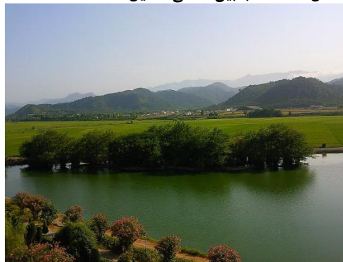
شکل ۱-۶ تالاب بین المللی استیل