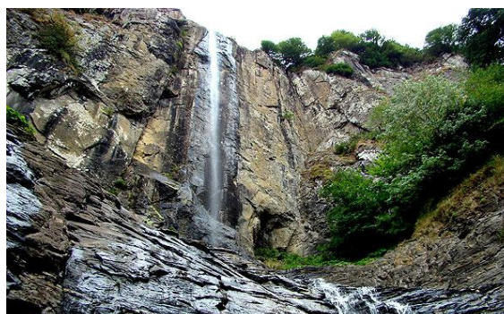
شکل ۱-۲ آبشار لاتون