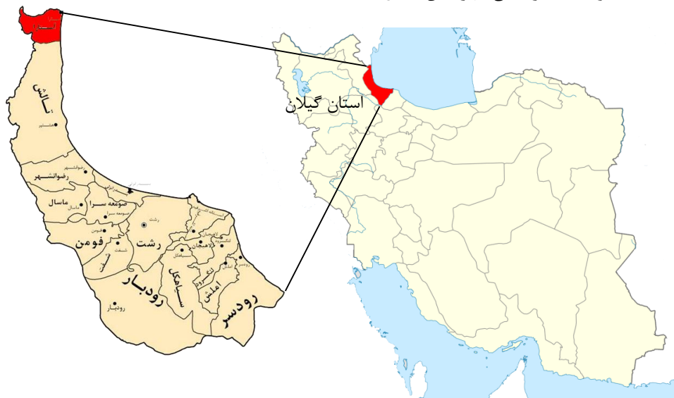
شکل ۱-۱ نقشه موقعیت جغرافیایی شهرستان آستارا

این منطقه با برخورداری از ویژگی های طبیعی و آثار فرهنگی و تاریخی، دارای ظرفیتی بالقوه در جذب گردشگران از نقاط مختلف کشور است. جاذبه های گردشگری منطقه را در سه گروه می توان جای داد: