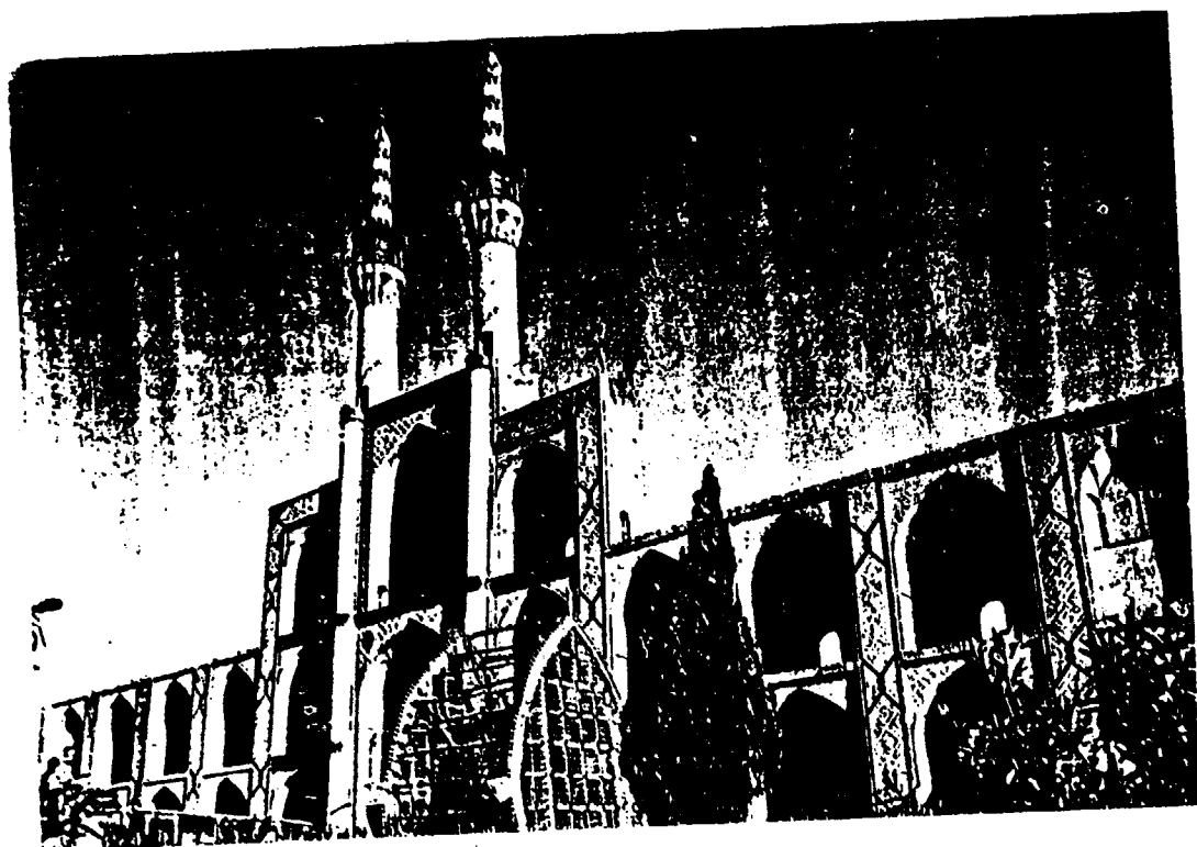
تکبه و فخل امیر چخماقی

در قرن هشتم و به ویژه قرن‌های نهم و دهم در دوره گورکانیان در شهر همچنان عمارات و ابنیه جدید احداث گردید که امروز قسمتهایی پابرجاست. به دستور امیر گورکانی داروغه وقت یزد مأمور ایجاد قلعه شهر شد. بخش‌ها و عناصری همچنین به شهر ضمیمه گردید و برجها و سنگ اندازهایی به ترکیب دیوار شهر افزوده شد و خندق ایجاد گردید و بر دروازه‌ها درهای آهنی نصب شد. در دوره حکومت میرزا