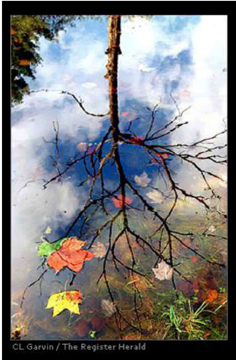
CL Garvin / The Register Herald

قشنگ یعنی، تعبیر عاشقانه اشکال... چشمها را باید شست، جور دیگر باید دید.