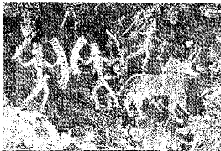
تصویر ۱. صخره نگاری های پیش از تاریخ هند-غار اروپا -شهر بوپال - ۵۵۰۰ ق.م.