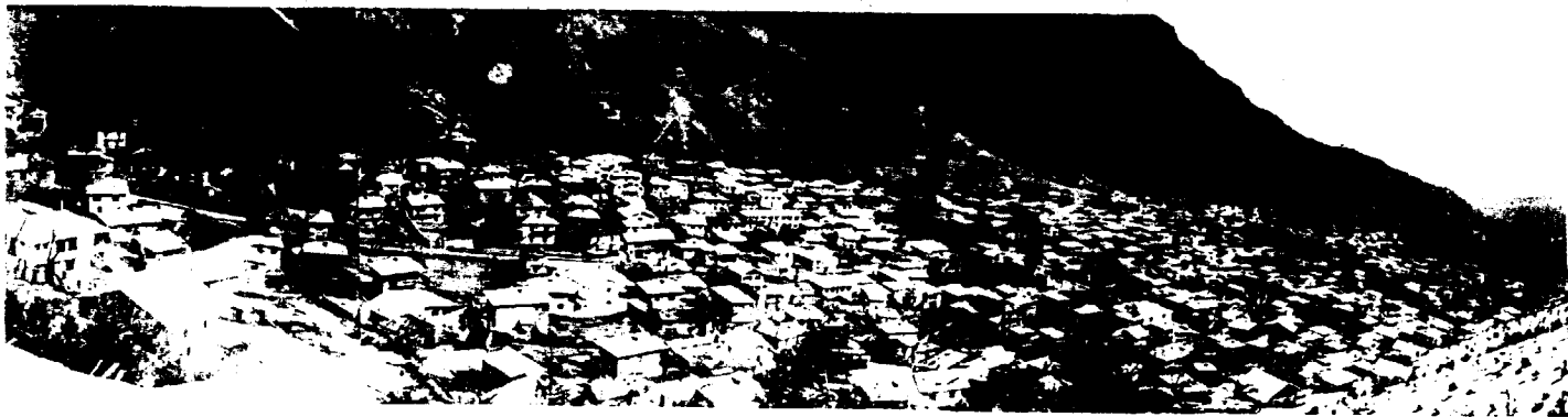
منظر جواهرده رامسر