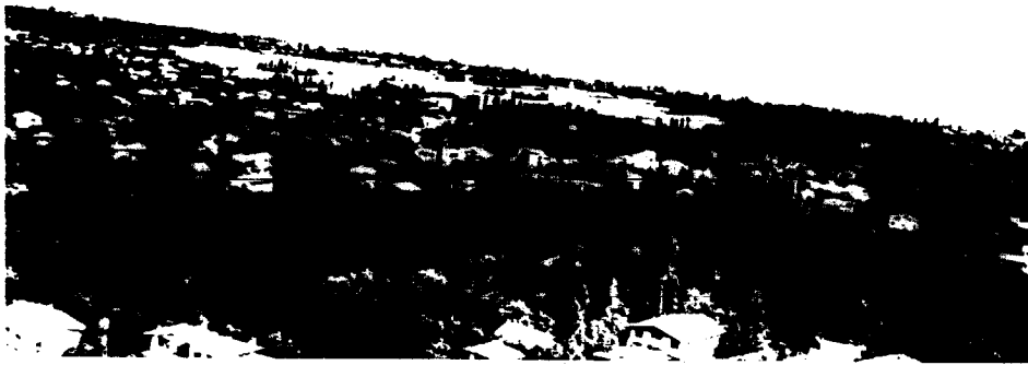
منظر شهر رامسر، ضلع غربی شهر

وجود جاذبه های طبیعی کمی فاصله کوه و دریا قله های مخروطی شکل مشجر به پوشش گیاهی جنگلی، باغات مرکبات و چای و مزارع برنج (شالیزار)، داشتن ساحل زیبا، آبگرم های معدنی، جاری بودن رودخانه های متعدد، وجود مناطق بیلابقی خوش آب و هوا، وجود هتل بزرگ رامسر و بلوار کازینو و هتل ساحلی خزر جملگی طبیعت زیبا و منحصر به فردی را برای این شهر ایجاد کرده که عروس شهرهای ایران لقب گرفته است.