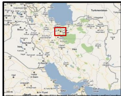
۱.۱. عنوان: نقشه استان تهران. مأخذ: www.tehran.ir ، مهر ۱۳۹۰.