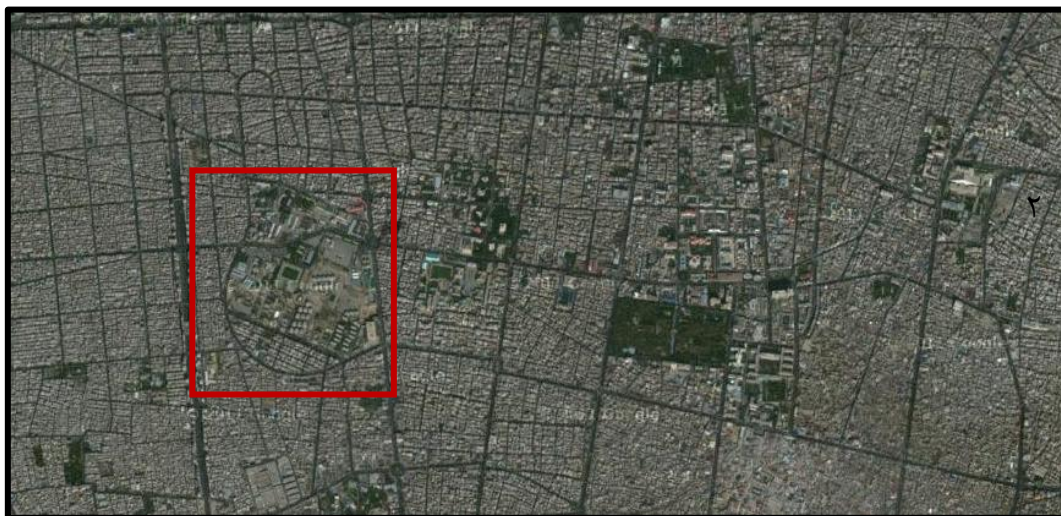
۱.۱. عنوان: عکس هوایی از محدوده (باغشاه) در بلوک شهری. مأخذ: www.google-earth.com ، مهر ۱۳۹۰.