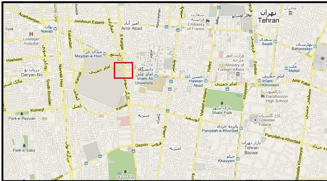
۳.۱. عنوان: نقشه میدان حر و محدوده اطراف آن. مأخذ: www.tehran.ir ، مهر ۱۳۹۰.