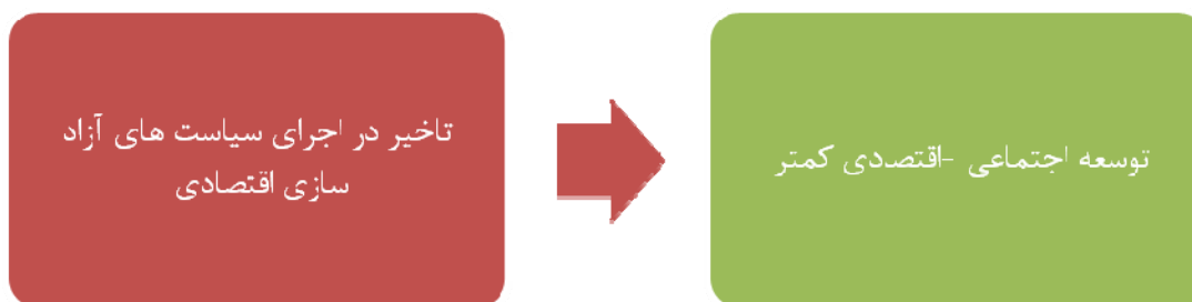
شکل (۲) متغیر مستقل و وابسته ازبکستان

به دلیل ماهیت مقایسه ای بودن پژوهش حاضر لازم است فرضیه را برای دو کشور گسترش داد. همچنین در فرضیه اصلی ما علاوه بر متغیر مستقل و وابسته متغیر دخیل نیز وجود دارد. که در شکل (۳) و (۴) نشان داده شده است.