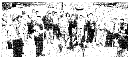
عکس ۱-۳- مشارکت مردم در روند طراحی

از آنجا که کیفیت طراحی شهری یک مکان ناگزیر از پاسخدهی مناسب به ابعاد گوناگون محیط شهری است میتوان مولفه های سازنده کیفیت طراحی شهری را مولفه هایی به موازات مولفه های سازنده مکان تعریف نمود. (گلکار، ۱۳۸۰) در نتیجه با توجه به مولفه های سازنده مکان و ویژگیهای آن میتوان