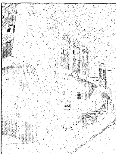
عکس ۱-۲- بناهای قدیمی در بوشهر