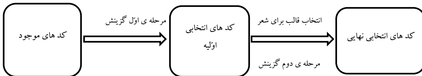
شکل ۳. فرآیند انتخاب قالب و کدهای مورد نیاز توسط شاعر

به دلیل انتخاب حافظ و مولوی برای بررسی مفاهیم ارتباطی در اشعارشان، شاعری که مد نظر قراردادده ایم، شاعری است که در دوران گذشته و در عصر کهکشان شفاهی ۱۸ سیر می کند، به همین جهت، شاعر بعد از رمزگذاری اشعارش از طریق دو مجرا بیشتر نمی تواند کلامش را منتقل کند؛ او باید اشعارش را یا خود برای دیگران بخواند و یا ساعت ها وقت گذاشته و آنها را مکتوب نماید تا بعداً دیگران دست نوشته هایش را خوانده و با مضمون کلامش آشنا شوند. در نهایت می توان گفت شاعر براساس قصد و نیتی که در ذهن دارد و در صدد انتقال آن به مردم است پیام خود را شکل می دهد و آن را به قالب شعر در می آورد. در واقع فرستنده یا همان شاعر، با شکل دادن پیام در ذهن و سنجش تاثیر آن بر روی مخاطب و سپس رمزگذاری آن به صورت شعر، از طریق مجرای کتاب، آن را به مردم انتقال می دهد. مخاطب نیز با استفاده از کتاب و رمزگشایی اشعار، تا حدودی پی به مقصود و نظر شاعر می برد و حلقه ی ارتباطی به پایان می رسد. این فرآیند بدین دلیل، حلقه ی ارتباطی گفته می شود که مخاطبان نیز توسط بازخورد ۱۹ و پس فرست ۲۰ های خود که فرقیشان به ترتیب در عقلانی بودن اولی و لحظه ای بودن و غیر عقلانی بودن دومی است، به شروع کننده ی حلقه ی ارتباطی یا همان شاعر وصل می گردند. بنابراین اگر مدل ارتباطی را برای شعر بخوایم ترسیم کنیم به مدل زیر می رسم که به بیشتر مدل های ارتباطی شبیه است. (شکل ۴).