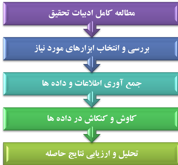
شکل ۱. فلوجارت روش تحقیق

مراحل انجام روش تحقیق به صورت خلاصه و کلی در نمودار زیر (شکل ۱) ارائه گردیده است: