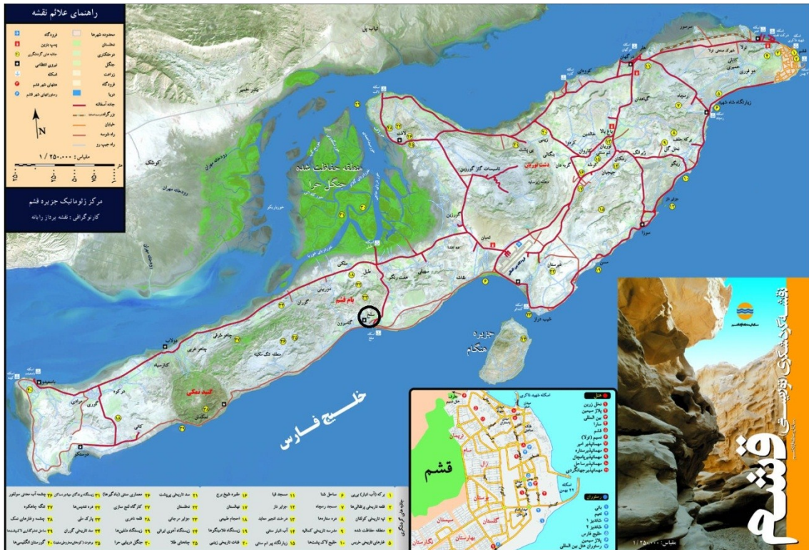
شکل ۲-۱: تصویر نقشه گردشگری جزیره قشم و موقعیت روستای سلخ در آن

روستای سلخ یکی از روستاهای جزیره قشم می‌باشد که دارای قابلیت بالقوه برای توسعه گردشگری، خصوصاً گردشگری صیادی می‌باشد. در این فصل به بررسی ویژگی‌های طبیعی و اجتماعی روستای سلخ می‌پردازیم و در ادامه روش انجام پژوهش را توضیح می‌دهیم. روستای سلخ یکی از روستاهای جزیره قشم است که در مختصات جغرافیایی ۲۶ درجه و ۴۴ دقیقه عرض شمالی و ۵۴ درجه و ۲۳ دقیقه طول شرقی قرار دارد (بختیاری، ۱۳۸۴). این روستا دارای قابلیت‌های گردشگری همچون گردشگری صیادی، بام قشم، کاسه سلخ و غار نمکی می‌باشد.