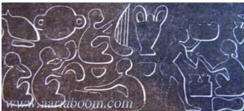
شکل ۱: مهری در چغامیش خوزستان مربوط به سال ۳۴۰۰ قبل از میلاد

در حفاریات تپه حصار آثاری پیدا شده که بعنوان بوقهای علامت دهنده بکار می‌برده‌اند، همچنین نقش مهری در چغامیش خوزستان مربوط به سال ۳۴۰۰ قبل از میلاد یافت شده که حاوی تصویر نوازندگان آلات موسیقی و وضعیت اجراکنندگان است. ۲