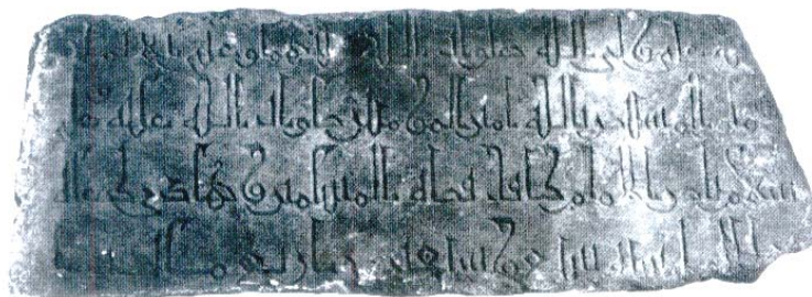
۲-۲ سنگ تراشه ای از خط کوفی تزئینی با سرها و انتها های پایانی حروف به شکل دندانه

مشهور شد. در نتیجه خط جدیدی بوجود آمد، که اندازه های متناسب و مشخصی داشت و بیانگر چهارگوش ها و زاویه هایی با استفاده از سرکش های عمودی کوتاه و خطوط افقی امتداد یافته بود، که به عنوان خط الكوفی (خط کوفی) مشهور شد، که نه تنها جانشین تمام مقاصد اصلاح گرایانه قبلی شد، بلکه بنیادی ترین اثرات را بر روی تمامی تحولات آینده خوشنویسی عربی گذاشت.