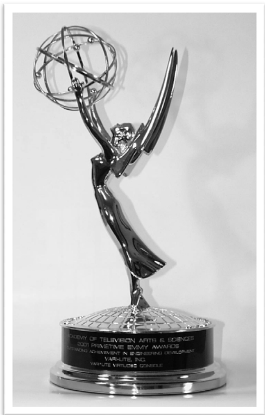
شکل ۱- تندیس جایزه امی