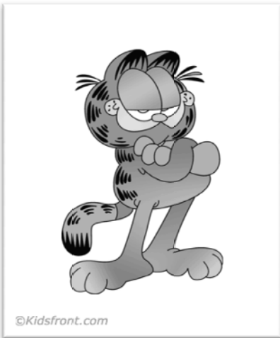
شکل ۳- گارفیلد

اگرچه شبکه فاکس می‌توانست سیمپسون‌ها را در بخش‌های دیگر مسابقه مانند سریال‌های کمدی شرکت دهد اما قوانین اجازه نمی‌دهد که هر برنامه در بیشتر از یک موضوع شرکت کند.