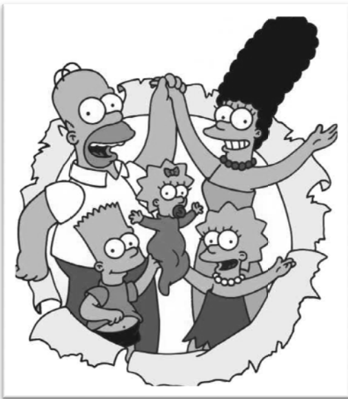
شکل ۲- سریال انیمیشنی خانواده سیمپسون‌ها

جایزه امی برای برنامه‌های انیمیشن پرایم‌تایم خود به دو بخش: جایزه امی پرایم‌تایم برای