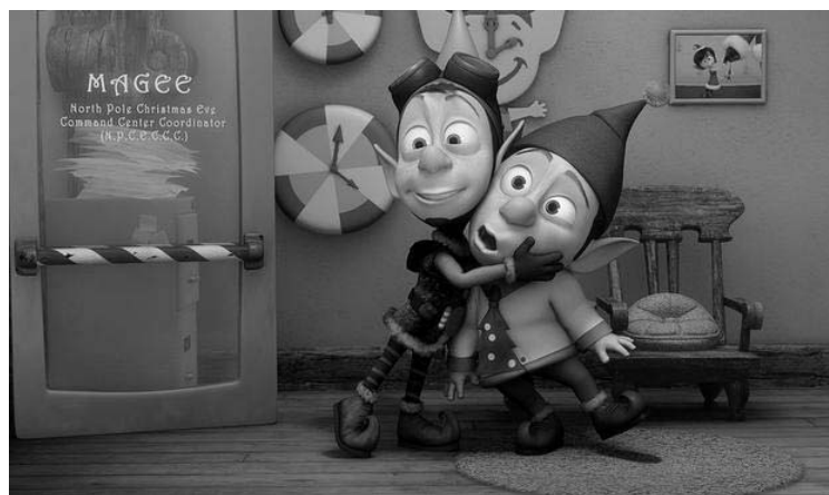
«پریپ و لندینگ»، ساخته دیزنی برنده جایزه امی سال ۲۰۱۰