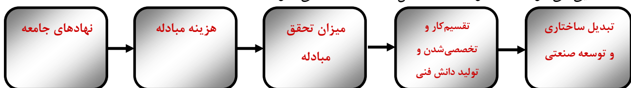
شکل (۱-۱) فرایند تحقق مبادله

شناسایی می‌شوند. همانگونه که در شکل (۱-۱) مشاهده می‌شود.