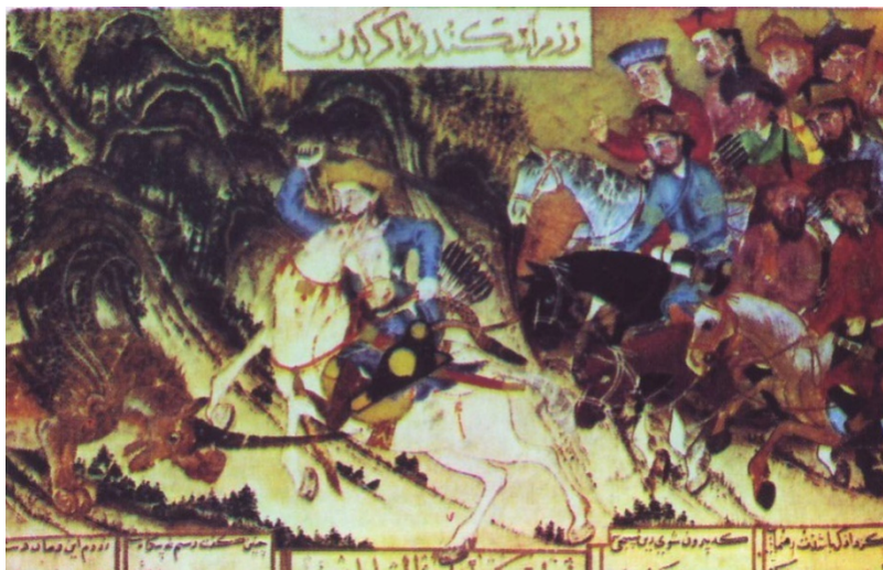
شاهنامه فردوسی (دموت) جنگ اسکندر و اژدها

در قرن اول هجری، اسلام رایج ترین دین و عربی زبان رایج ایران و کشورهای همسایه به شمار می آمد. در قرن دوم هجری زبان فارسی دری پا به عرصه ی وجود گذاشت. رودکی، پدر ادبیات کلاسیک ایران، در اواخر قرن سوم هجری، ادبیات را به اوج رساند. از آن زمان به بعد ادبیات ایران حرکتی شتابان و رو به رشد را آغاز کرد. در هر عصر ادیب و نابغه ای در عرصه ی ادبیات ایران ظاهر شد. در اواخر قرن چهارم حکیم فردوسی اثر جادوانه ی خود، شاهنامه، را سرآید. ۴