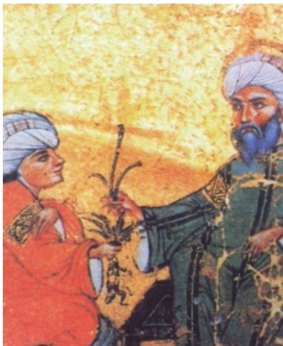
برگی از کتاب مخیر الخاص، مکتب سلجوقی

از خصوصیات بارز نگارگری ایرانی بعد از اسلام پیوستگی و پیوند آن با آیین سخنوری و ادب پارسی است؛ تا بدان حد که همواره این دو در هنر کتاب آرایبی ایرانیان به صورت اجزائی جدایی ناپذیر از هم در آمدند. نگارگران واژگان و ابیات سخنوران و شاعران را در قالب خط، رنگ، و سطح درهم می آمیختند تا تصاویری نو بیافرینند. غایت و هدف مولف و نگارگر دست یافتن به صور خیال و برداشت و درک صحیح تر از حقایق ازلی بود. بدین جهت مشاهده می کنیم که در فرهنگ و ادب ایرانی صور خیال در شعر و نگارگری ایرانی همدیگر را به خوبی پوشش داده اند و در اینجاست که می توانیم شاهد رواج توصیفات شاعران و ادیبان ایرانی در آثار مکتوب باشیم، از جمله: توصیفات نظیر قد سرو، شب لاجوردی، خورشید زرین، روی ماه وغیره که موجب پیدایش عناصر تصویری معادل توسط هنرمندان نگارگر گردید.