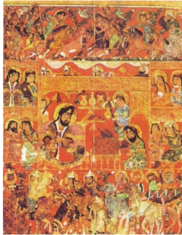
سرلوحه کتاب التریاق، صحنه های دربار

از این رو، غالب آثاری که در تاریخ نقاشی و نگارگری ایران که به عنوان اسناد و گواه معتبر به شمار می آیند مربوط به دوران پس از اسلام است.