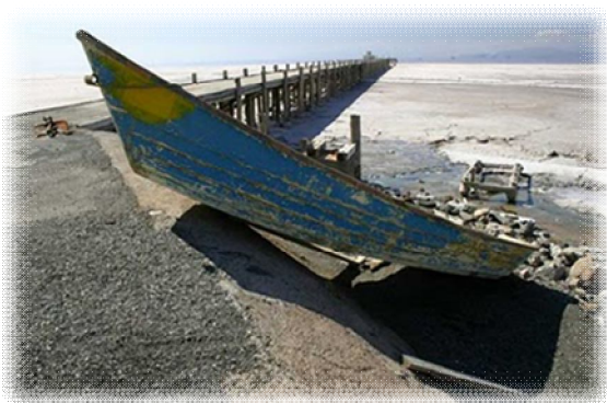
تصویر 1-3- ساحل و اسکله‌ی بدون آب و قایق به خشکی نشسته