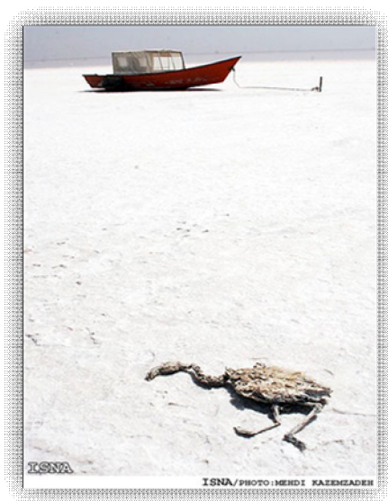
تصویر 1-2- جسد فلامینگو در کنار قایق به نمک نشسته در دریاچه‌ی ارومیه