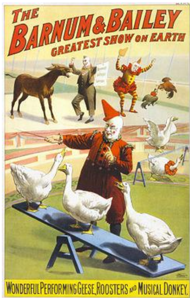
شکل ۱. پوستر سیرک بارنوم و بیلی