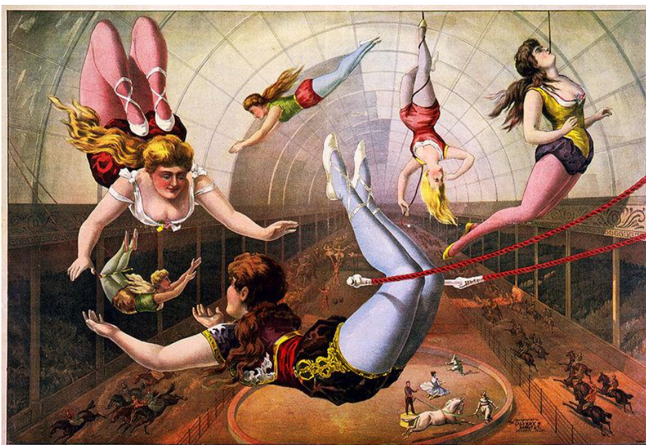
شکل ۳. هنرمندان طناب‌باز در تصویر چاپی توسط شرکت کال ورت لیتو، سال ۱۸۹۰

در سال ۱۸۴۰ توماس کوک ۵ سوارکار در بازگشت از آمریکا به انگلستان با خود یک چادر سیرک آورد. در این زمان سیرکهای سیار در بریتانیا معروف شدند. برای مثال سیرک ویلیام بتی ۶ ، بین سالهای ۱۸۳۸ و ۱۸۴۰ از نیوگسل به ادینبورگ سفر می‌کرد و سپس به پورتنس ماوت و ساوت همپتون باز می‌گشت.