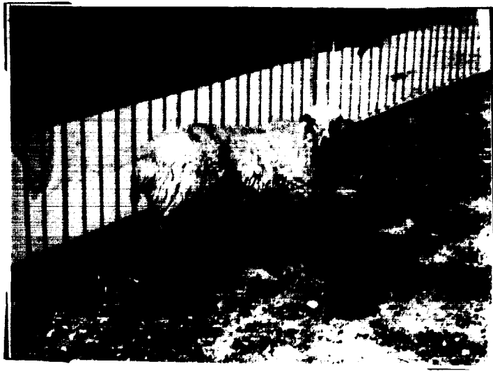
مش نژاد زل