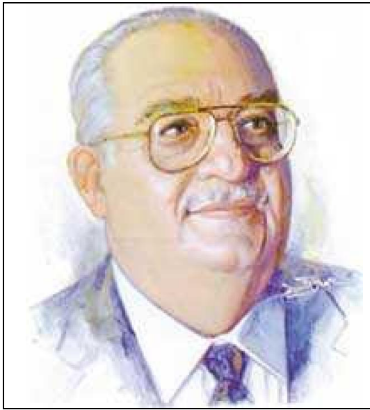
تصویر 1- شبرزاد حسن (1951-)