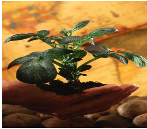
شکل ۱: گیاه سیب زمینی Solanum tuberosum

قسمت هوایی این گیاه در اثر سرمای زمستان خشکیده و از بین می رود ولی غده های باقی مانده در خاک می توانند در بهار سال بعد جوانه زده و گیاه جدیدی را تولید نماید. بنابراین، سیب زمینی گیاهی چند ساله بوده اما برای تولید محصول، گیاهی یکساله محسوب می شود (۱۳).