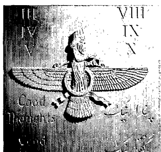
عکس ۱-۱- نماد فروهر