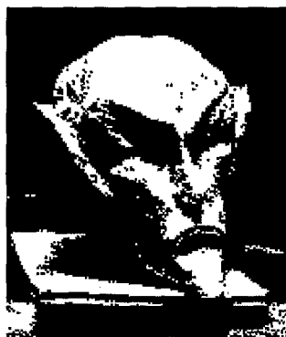
عکس ۱-۵- اهریمن

اهریمن (از اوستایی انگره‌مینو) بدنهاد است. اهریمن پلیدی است و برای از بین بردن نیکی تلاش می‌کند ولی چون دون و پست مایه است و اهورامزدا آگاه بر هر چیز است پس سرانجام در پایان کار اهریمن نابود شده و اورمزد بر او چیره می‌شود و کار جهان یکسره به نیکی خواهد گرایید. در این میان انسان و امشاسپندان و دیگر ایزدان (فرشته) و موجودات نیک (مزدا آفریده) که همگی آفریده‌ی اهورامزدا هستند در مبارزه با دئوها (دیوها) که موجودات و پدیده‌هایی اهریمنی هستند در تلاشی کیهانی برای پیروزی نیکی بر بدی هستند. اهریمن را در پارسی اهرمن هم می‌گویند. می‌شود او را همتای شیطان در باورهای سامی دانست. در دین زرتشت باور بر این است که در طبیعت دو نیروی متضاد خیر (سپنتا مینو - اثر روشنی) و شر (انگره مینو - اثر تاریکی) وجود دارد که همواره در حال نبرد با یکدیگرند. ۹