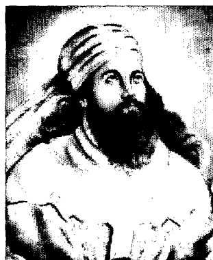
عکس ۱-۴- سخنان زرتشت در اوستا