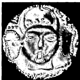
عکس ۱-۶- اهریمن