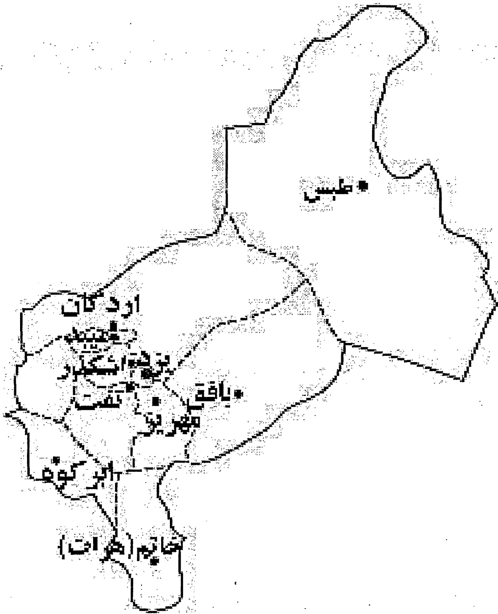
1 - The geographical situation of Abarkouh town