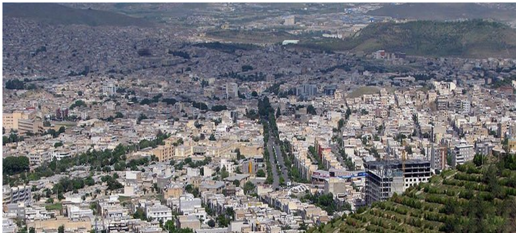
سراسرنمای سنندج از آبدر

واقع سنندج معرب واژه مرکب «سنه‌دژ» می‌باشد «سنه» در فرهنگ لغات اوستایی به معنای شاهین و عقاب است هرچند که در مورد واژه سنه تعاریف دیگری نیز وجود دارد.